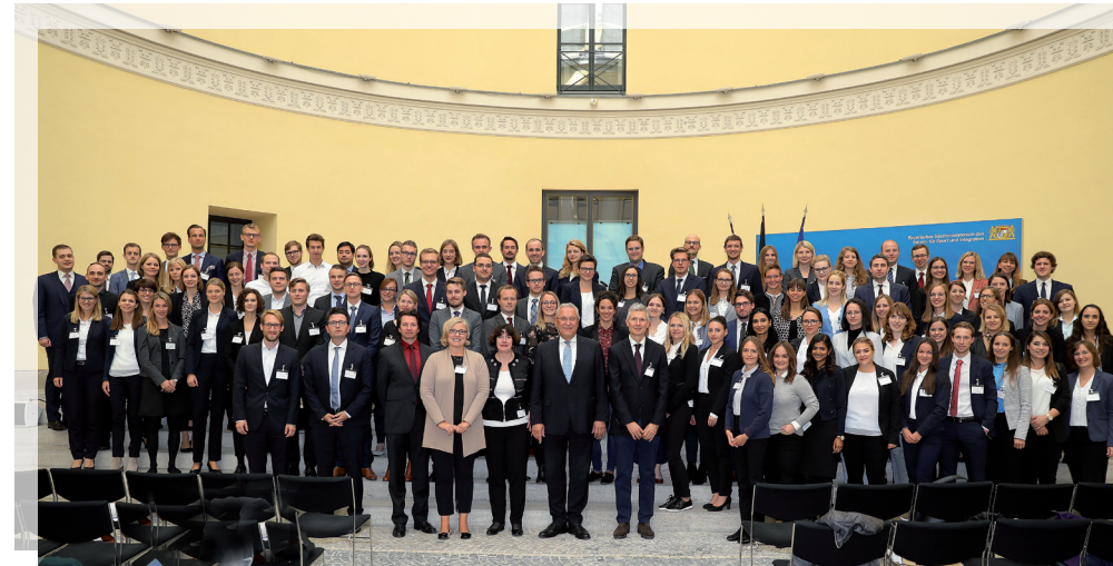
Jährliche Begrüßung der Neueingestellten im Ministerium