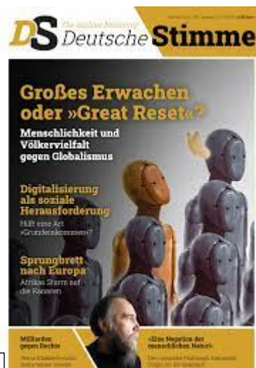
Cover der Zeitschrift Deutsche Stimme

Die im Zuge der Verschwörungstheorie „Great Reset“ verbreitete Darstellung der Initiative als „globalistisches“ Projekt bietet auch zahlreiche Anknüpfungspunkte für Rechtsextremisten sowie Reichsbürger und Selbstverwalter. So inszeniert sich beispielweise das NPD-Magazin „Deutsche Stimme“ in einem auf Telegram von der NPD Bayern weitergeleiteten Beitrag vom 8. Februar im Rekurs auf den „Great Reset“ als „Gegner“ der vermeintlichen „Globalisierungsfanatiker“. Die Februar-Ausgabe der „Deutschen Stimme“ titelte „Großes Erwachen oder ‚Great Reset‘? Menschlichkeit und Völkervielfalt gegen Globalismus“. Das Compact-Magazin, das vom Bayerischen Landesamt für Verfassungsschutz als Beobachtungsobjekt im Phänomenbereich Rechtsextremismus bearbeitet wird, machte den „Great Reset“ in seiner April-Ausgabe ebenfalls zum Titelthema. Ähnliche Anknüpfungspunkte existieren auch in der Szene der Reichsbürger und Selbstverwalter. So werden beispielsweise