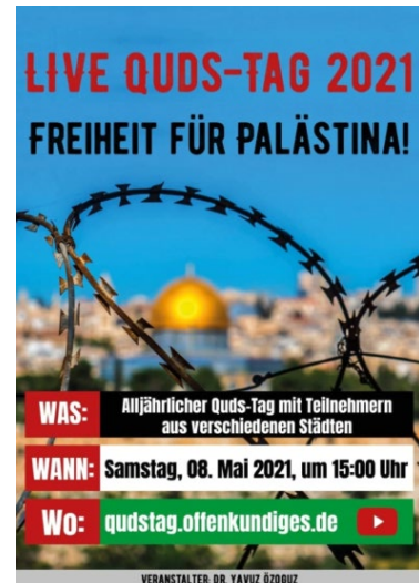
Propagandabild zum „al-Quds-Tag“

Im islamistischen Spektrum findet sich die Zusammenführung realweltlicher Aktivitäten mit dem virtuellen Raum insbesondere beim „al-Quds-Tag“ („Jerusalemtag“), in dessen Rahmen seit 1979 jährlich am Ende des islamischen Fastenmonats Ramadan zur „Befreiung“ Jerusalems aufgerufen wird. Pandemiebedingt findet die Veranstaltung seit zwei Jahren sowohl digital als auch in kleinerem Maßstab auf der Straße statt. Wie bereits im Jahr 2020 wurde der normalerweise in Berlin stattfindende „al-Quds-Tag“ aufgrund der geltenden Corona-Beschränkungen auch in diesem Jahr abgesagt und stattdessen als fast zweistündiger, moderierter Livestream mit Live-Beiträgen u. a. aus Berlin, Bremen, Hannover und Nordrhein-Westfalen abgehalten. Während 2019 bei der letzten realweltlichen Veranstaltung in Berlin circa 1.200 Teilnehmer anwesend waren, wurde die diesjährige Live-Übertragung unter dem Motto „Live Quds-Tag 2021 – Freiheit für Palästina!“ auf YouTube rund 3.400 Mal abgerufen. Somit wurde online zwar ein nahezu drei Mal so großes Publikum erreicht, allerdings blieb eine größere mediale Berichterstattung zum „al-Quds-Tag“ weitgehend aus und auch die ansonsten üblichen Gegendemonstrationen fanden nicht statt. Letztlich dürfte das Ereignis trotz hoher Klickzahlen einer breiteren Öffentlichkeit entgangen sein.