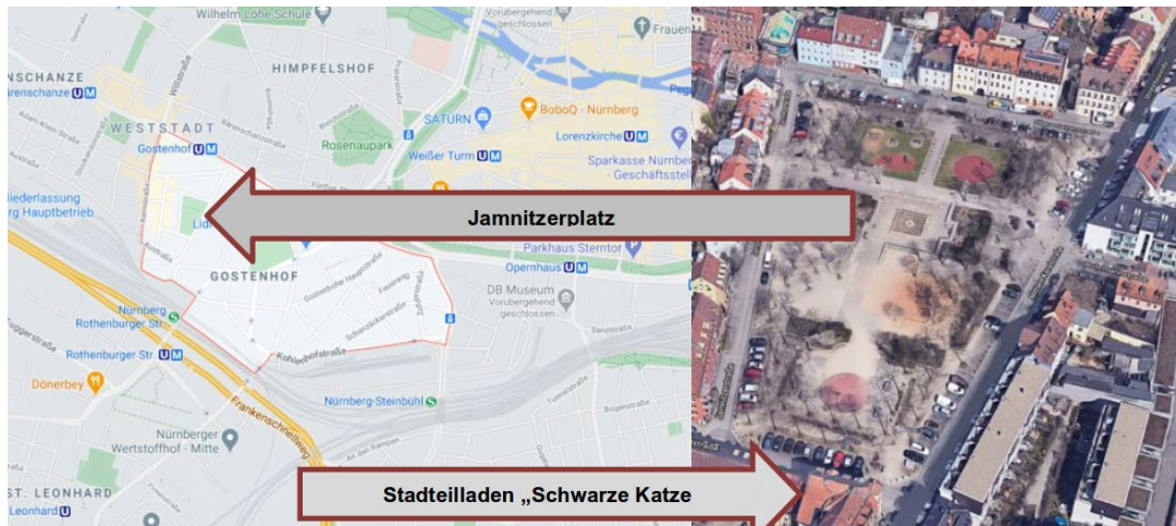
Die Karte des Stadtteils Gostenhof in Nürnberg zeigt die Standorte des Jamnitzerplatzes und des Szene-Lokals „Schwarze Katze“

einer umfassenden Sanierung des Stadtteils, um seinem Ruf als "Glasscherbenviertel" entgegenzuwirken. Gostenhof zählt seit dem Ende der 1980er Jahre zu einem der wichtigsten linksextremistischen Kristallisationspunkte in Bayern. Der Jamnitzerplatz, im Zentrum von Gostenhof gelegen, ist einer der bevorzugten Treffpunkte der örtlichen linksextremistischen Szene. In direkter Umgebung befindet sich auch seit mehreren Jahren das Szene-Lokal „Schwarze Katze“, das Linksextremisten als Treffpunkt und Anlaufstelle dient. Das Lokal ist Teil des „Selbstverwaltete[n] Kommunikationszentrum[s] Nürnberg e. V.“ (KOMM e. V.), das ebenfalls von linksextremistischen bzw. linksextremistisch beeinflussten Gruppierungen aufgesucht wird. Dort treffen sich, neben der postautonomen „Roten Hilfe“ (RH), die autonomen Gruppierungen „Organisierte Autonomie“ (OA) sowie die „Revolutionär Organisierte Jugendaktion“ (ROJA), die als unabhängige Jugendorganisation der OA zu betrachten ist.