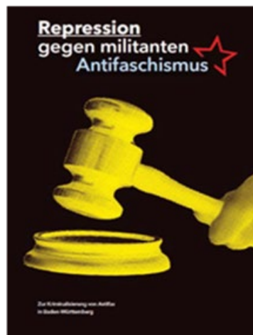
Propagandabild der Perspektive Kommunismus

Am 16. Mai 2020 wurden drei Angehörige der Gewerkschaft „Zentrum Automobile e. V.“ in Stuttgart auf dem Weg zu einer Querdenken-Demonstration durch eine Gruppe von 20-40 Linksextremisten angegriffen und schwer verletzt. Einer der Geschädigten erlitt lebensgefährliche Verletzungen und musste für einen Monat in ein künstliches Koma versetzt werden. In der Folge dieses Überfalls kam es zu mehreren Festnahmen. Gegen zwei Personen wurde Anklage erhoben. Die Gewerkschaft „Zentrum Automobile e. V.“ wird von Linksextremisten aufgrund ihrer vermeintlichen Nähe zur AfD als faschistisch angesehen. Das linksextremistische Bündnis „Perspektive Kommunismus“ (PK) veröffentlichte am 26. März 2021 eine Broschüre mit dem Titel „Repression gegen militanten Antifaschismus“. In der Broschüre, die direkten Bezug auf den Angriff auf die Gewerkschafter nimmt, wird Militanz gegenüber „Faschisten“ „in bestimmten Situationen“ als notwendig und legitim erachtet. Ihrem Selbstverständnis nach wähen sich die Autoren in einem Untergrundkampf vergleichbar mit den jugoslawischen Partisanen während des Zweiten Weltkrieges. Ihrer Ansicht nach sei „die Gewalt die in bestimmten Situationen Teil des antifaschistischen Widerstands sein soll“ gerechtfertigt: