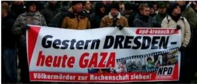
Propagandabild der NPD

Auch der islamistische Antisemitismus orientiert sich unter anderem an antisemitischen Narrativen aus dem europäischen und amerikanischen Nationalismus des 19. und 20. Jahrhunderts und des Nationalsozialismus. Seit der Staatsgründung Israels vermengen sich diese klassisch-antisemitischen Mythen überdies mit einem zusätzlich israelbezogenen Antisemitismus und der Idee einer jüdischen bzw. antiislamischen Weltverschwörung. Gruppierungen, die dem islamistischen al-Qaida-Netzwerk angehören, haben während der jüngsten Eskalation des Nahostkonflikts im Mai die Muslime im Allgemeinen und ihre Anhänger im Besonderen zu Angriffen auf israelische und jüdische Ziele sowie im Zuge von Einzeltäteranschlägen zur Tötung von Juden, Israelis und US-Amerikanern weltweit aufgerufen. Die Gruppierungen „Hamas“ und „Bewegung des Islamischen Jihad in Palästina“ stellen den bewaffneten Konflikt mit Israel und den dort lebenden Juden seit jeher ins Zentrum ihrer Propaganda.