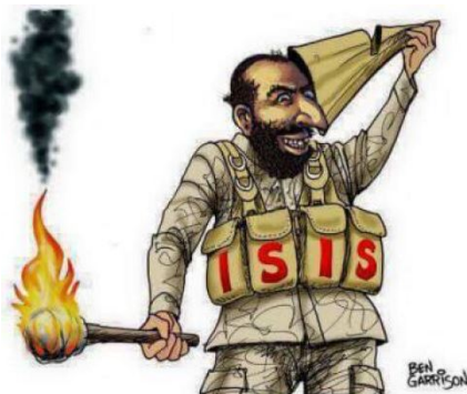
Varianten des Propaganda-Meme „The Happy Merchant“ (deutsch: „Der glückliche Kaufmann“)

Deutlich sichtbar wurde der phänomenbereichsübergreifende Antisemitismus im virtuellen Raum seit dem erneuten Aufflammen des Nahostkonflikts im Mai: In beinahe allen Phänomenbereichen waren ein verstärkter israelbezogener Antisemitismus und sogenannte „Boykottaufrufe“ gegen Israel festzustellen, über die eine prinzipielle Ablehnung des Judentums zum Ausdruck gebracht wurde.