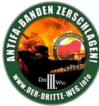
Propagandabild des III. Weg

Im Anschluss an die Forderung, „linksextreme Strukturen zu benennen und zu zerschlagen“, verwies der „III. Weg“ auf „regelmäßige Sicherheitsschulungen“ seiner Arbeitsgruppe „Körper & Geist“. Die im Jahr 2018 gegründete