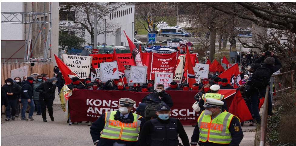
zu Protest- marsch in Stuttgart