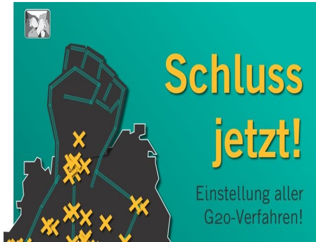
Propagandabild Rote Hilfe

Die Aufarbeitung des Hamburger G20-Gipfel 2017 ist nach wie vor von großem öffentlichen Interesse. Am 3. Dezember 2020 begann der erste der sogenannten „Rondenberg“-Prozesse vor dem Hamburger Landgericht. Den Angeklagten wird vorgeworfen, als Teil einer Gruppe von etwa 200 De-