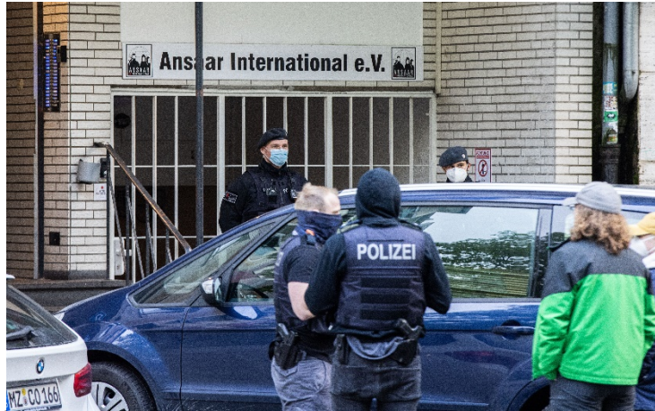
Durchsuchung von Vereinsräumen von Ansaar International e. V.

ein in Markt Schwaben von Ansaar-Aktivisten genutzter Altkleidercontainer versiegelt. Insgesamt wurden neben einer Vielzahl elektronischer Datenträger sowie diverser Papierunterlagen (u. a. Vereinsunterlagen, Flyer) auch eine erhebliche Summe an Bargeld sowie Guthaben auf Konten sichergestellt.