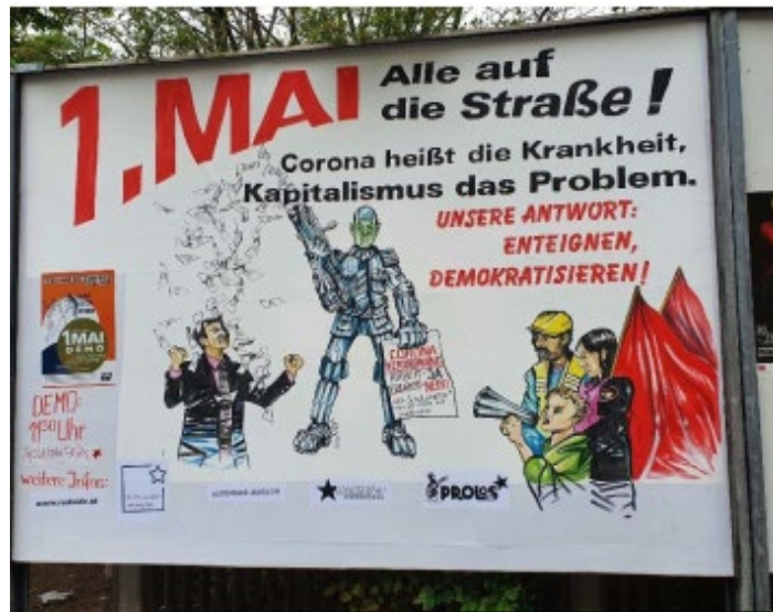
Demonstrationsaufruf zu 1. Mai-Protesten in Nürnberg

Verstößen gegen die Versammlungsauflagen, etwa in Zusammenhang mit Mindestabständen, verknoteten Seitentransparenten und dem Abbrennen von Pyrotechnik, störungsfrei. Im Anschluss an die Versammlung fanden im Szenestadtteil Gostenhof mehrere stationäre Kleinkundgebungen als