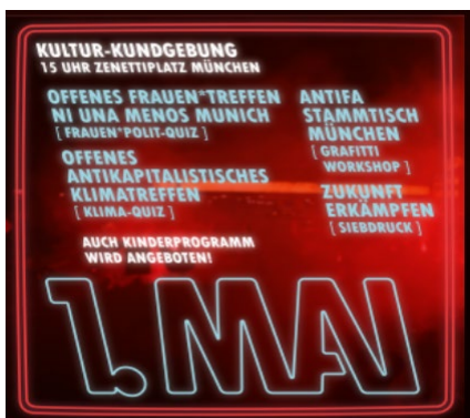
Internetaufruf zu 1. Mai-Protesten in München

Der 1. Mai hat als „Kampftag der Arbeiterklasse“ für die linksextremistische Szene eine besondere Bedeutung. Trotz der pandemiebedingten Beschränkungen und Auflagen waren in zahlreichen deutschen Städten in Teilen linksextremistisch beeinflusste Kundgebungen und Demonstrationen zu verzeichnen, u. a. in Aschaffenburg, Augsburg, Bamberg, Ingolstadt, Regensburg und Würzburg. Wie bereits im Vorjahr wurden die Großveranstaltungen des Deutschen Gewerkschaftsbundes in München und Nürnberg abgesagt bzw. als Online-Veranstaltung durchgeführt. Die linksextremistische Szene nutzte daher auch dieses Jahr die Gelegenheit, eigene Veranstaltungen auf die Beine zu stellen und zahlreiche Personen für die Teilnahme an den Demonstrationen zu mobilisieren.