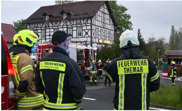
zu Brandanschlag in Kloster Veßra

Monat später ereignete sich am 28. Mai ein weiterer Brandanschlag auf ein Gasthaus und rechtsextremistischen Szenetreff in Kloster Veßra (Thüringen).