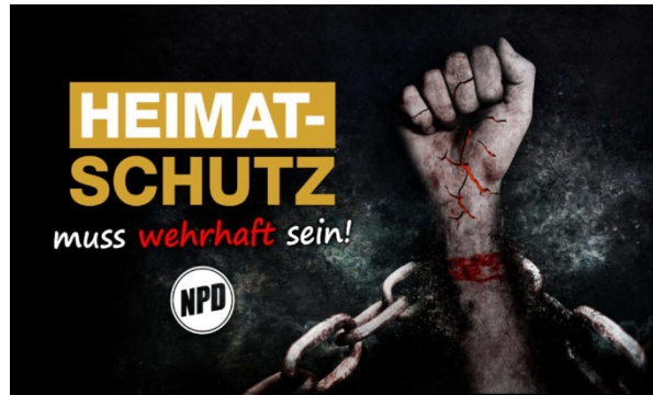
Propagandabild der NPD

Die NPD-Aktion „Schutzzone“ ist Bestandteil rechtsextremistischer Bürgerwehr- und Patrouille-Aktionen. Rechtsextremisten suggerieren, dass der Staat und seine Sicherheitsorgane nicht mehr in der Lage seien, die Sicherheit der Bürger zu