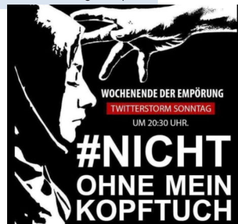
Propagandabild der #nichtohneinkopftuch-Kampagne der Generation Islam

Eine der erfolgreichsten Kampagnen wurde im April 2018 im Rahmen einer Diskussion um ein mögliches Kopftuchverbot an Schulen unter dem Hashtag #nichtohneinkopftuch von „Generation Islam“ durchgeführt. Weil das Thema direkt an die Lebensrealität junger Menschen anknüpfen konnte, wurden zum Hashtag weit über 70.000 Postings abgesetzt und damit zeitweise sogar Platz drei der tagesbezogenen Trendliste von Twitter in Deutschland erreicht. Die genuin islamistische Urheberschaft wurde als harmlose Anti-Diskriminierungsmaßnahme getarnt, was letztlich dazu führte, dass sich auch Personen des öffentlichen Lebens an der Verbreitung des Hashtags beteiligten. In der Gesamtschau kann die Aktion als „virtueller Flashmob“ beschrieben werden, wobei die digitale Reichweite das Potenzial eines realweltlichen Flashmobs deutlich überstieg.